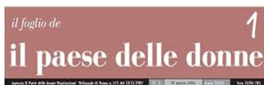
1946: il voto delle donne

Le tante redazioni femministe che ha fondato e/o diretto, il suo impegno in RAI e nelle testate come – “Radio Donna”, “Quotidiano Donna”, “Paese delle donne” in Paese Sera, e infine “Il Foglio de il Paese a generazioni di conoscermi del movimento delle ha dato un contributo a tante sfumature le molteplici sfumature del femminismo italiano.