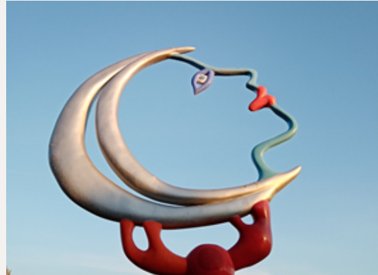
Niki de Saint Phalle, Giardino dei Tarocchi, Capalbio (Gr)

Il fenomeno delle violenze, fisiche e psicologiche, che si perpetrano sia all'interno delle realtà familiari sia nel contesto professionale, è una emergenza sociale trasversale che non accenna ad esaurirsi e che, anzi, con le restrizioni adottate a causa della pandemia ha fatto registrare una impennata. L'incremento del lavoro agile ha, indubbiamente, imposto la considerazione che tale modalità lavorativa, sebbene per un verso sia una opportunità per garantire una maggiore efficienza dell'attività amministrativa in uno al miglioramento della qualità di vita, dall'altro impone una particolare attenzione alle condizioni in cui si espleta la prestazione lavorativa, affinché non rappresenti un'ulteriore occasione per i fenomeni di violenza domestica.