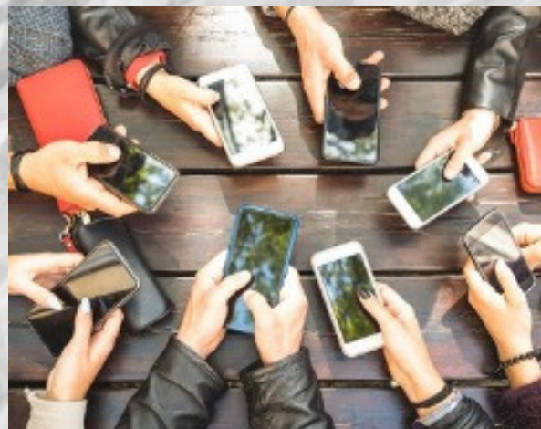
Adolescenti con smartphone

la data scelta coincide con il giorno in cui l'Assemblea generale ONU adottò la Dichiarazione (1959) e poi la Convenzione (1989) sui diritti del fanciullo. Con la Convenzione si è sradicata l'idea che il bambino sia esclusivamente un soggetto da tutelare e proteggere e si è affermato il bambino come titolare di diritti universali. Sono stati garantiti il diritto al nome, alla sopravvivenza, alla salute e all'educazione, alla dignità e alla libertà di espressione. Nell'era della digitalizzazione un nuovo diritto prende piede ed è quello legato alla garanzia di un ambiente digitale sicuro. Il nuovo Commento generale alla Convenzione internazionale sui Diritti dell'Infanzia difatti punta i riflettori sugli effetti negativi che una digitalizzazione non regolarizzata può provocare nei bambini. Tema particolarmente attuale in tempo di pandemia caratterizzato da smart working, didattica a distanza e ricorso massiccio ai dispositivi tecnologici per garantire servizi e relazioni.