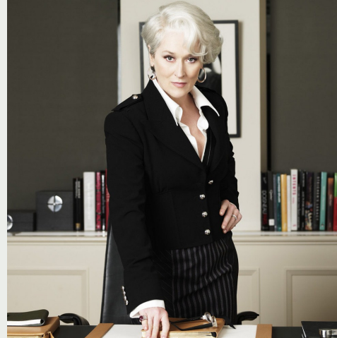
Meryl Streep in Il diavolo veste Prada

Finalmente arriva la certificazione della parità di genere nel mondo del lavoro, approvata anche dal Senato. La legge integra il preesistente “Codice delle pari opportunità” e mira ad incentivare la presenza delle donne lavoratrici nelle organizzazioni aziendali, e a ridurre il cosiddetto “Gender Pay Gap”, il divario salariale fra uomini e donne a parità di competenze. Le nuove norme integrano, tra l'altro, la nozione di discriminazione diretta e indiretta, includendo nelle fattispecie pure gli atti di «natura organizzativa o oraria» che sfavoriscono la componente rosa. Nel mirino, pertanto, finiscono quei trattamenti che, «in ragione del sesso, dell'età anagrafica, delle esigenze di cura personale o familiare, dello stato di gravidanza nonché di maternità o paternità, anche adottive», pongano chi lavora in «posizione di svantaggio rispetto alla generalità degli altri» creando ostacoli circa l'avanzamento e la progressione nella carriera.