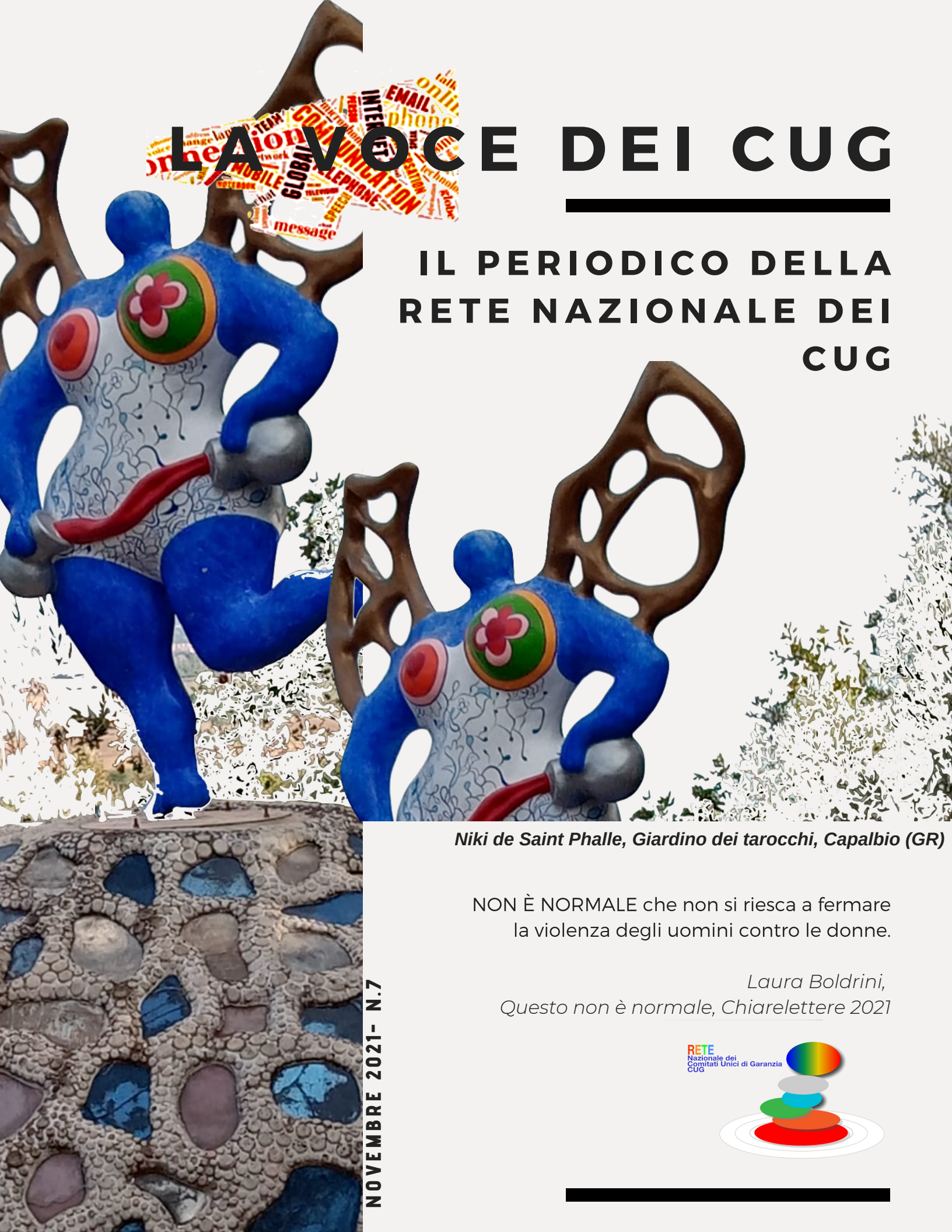
Niki de Saint Phalle, Giardino dei tarocchi, Capalbio (GR)

NON È NORMALE che non si riesca a fermare la violenza degli uomini contro le donne.