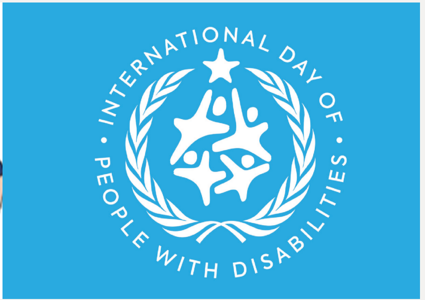
Logo: International day of people with disabilities