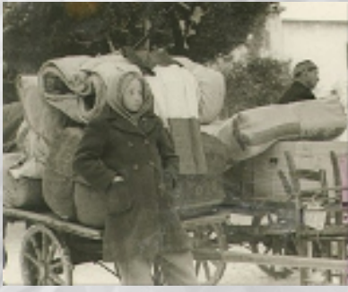
Giovane esule italiana in fuga trasporta, insieme ai propri effetti personali, una bandiera tricolore (1945)