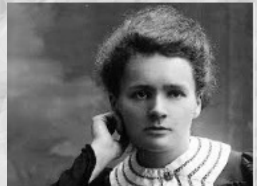
Marie Curie «Com'è essere sposati a un genio? Non so, chiedetelo a mio marito»

La famosa risposta di Marie Curie alla domanda riferita al marito non è solo una battuta di spirito ma la capacità di vedere il mondo da un'altra prospettiva, quella delle donne, appunto.