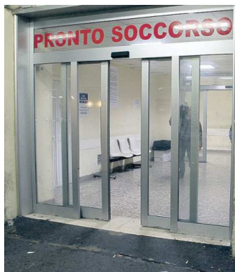
La vittima è giunta in arresto cardiaco al pronto soccorso dell'ospedale "Santissima Annunziata". Vani tutti gli sforzi dei medici per salvarle la vita e far nascere la bimba che aveva in grembo

L'ambulanza ha percorso soltanto qualche centinaio di