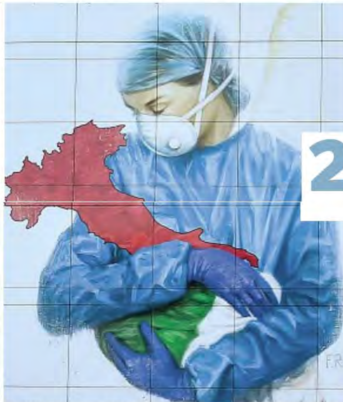
Nel 2020 Murales all'Ospedale Papa Giovanni di Bergamo per ringraziare medici e infermieri

In attesa che la commissione inizi a lavorare, sul Covid è subito bagarre. L'innescò arriva in fase di dichiarazioni di voto con le parole di Buonguerri. «Gli italiani — dice la deputata meloniana con trascorsi in Forza Italia, avvocata — devono sapere che FdI ha trascinato in tribunale Conte e Speranza, il peggior presidente del Consiglio e il peggior ministro alla Sanità della storia, per ottenere tra-