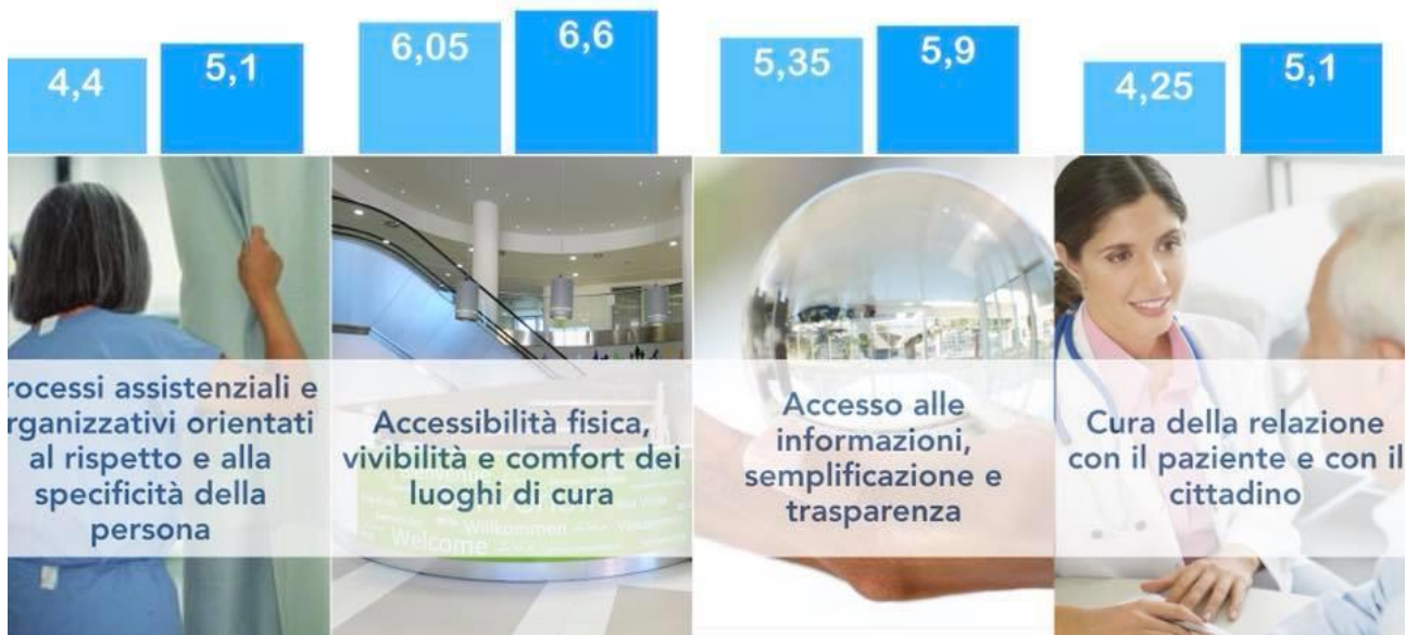
Punteggio provinciale per Area