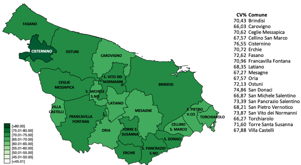
Cartogramma b.1. Copertura vaccinale (ciclo completo), per comune di residenza.