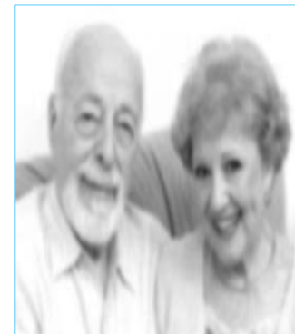
soggetti di età pari o superiore ai 65 anni