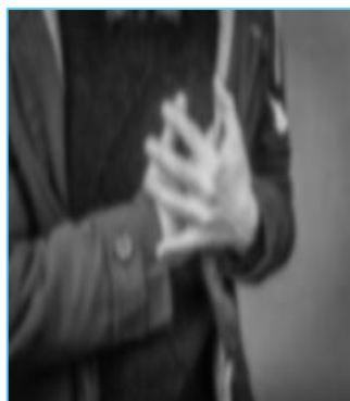
soggetti dai 6 mesi in su a rischio di complicanze per patologie pregresse o concomitanti