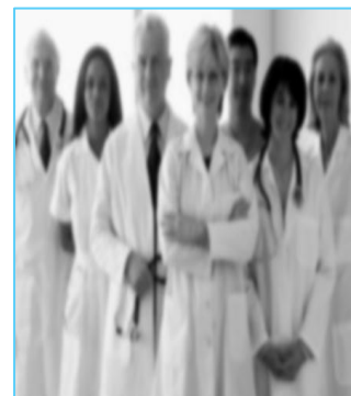
operatori sanitari che hanno contatto diretto con i pazienti