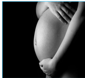
donne nel 2° e 3° trimestre di gravidanza

è offerto gratuitamente e attivamente a: