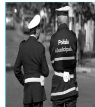
persone non a rischio che svolgono attività di particolare valenza sociale